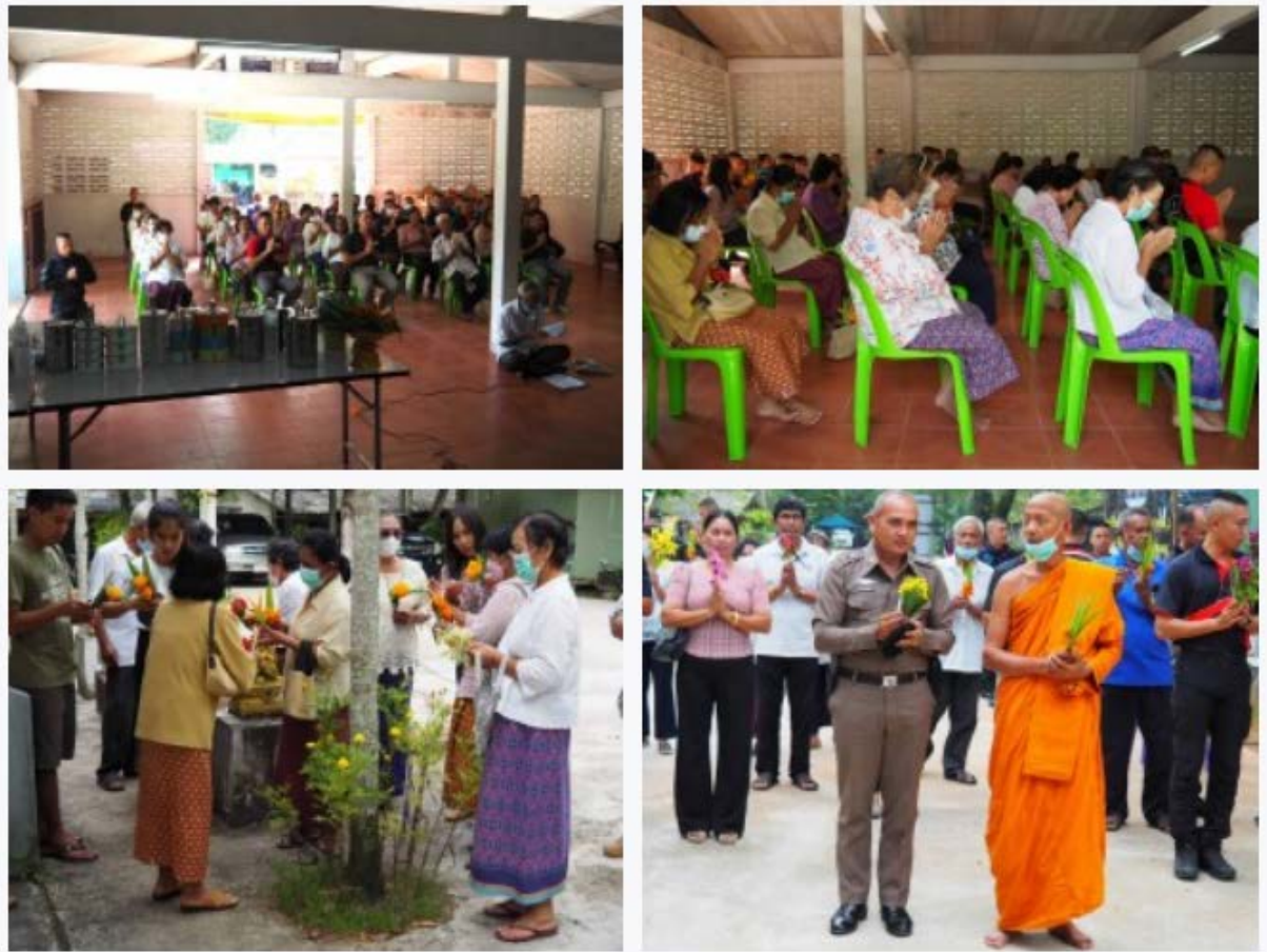
รูปภาพประกอบการทำกิจกรรม วันวิสาขบูชา วันที่ ๖ มีนาคม ๒๕๖๖