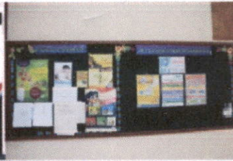
บอร์ดประชาสัมพันธ์ รพ.