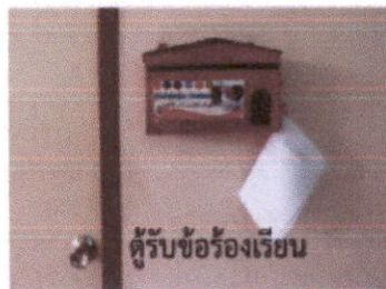
ตู้รับข้อร้องเรียน