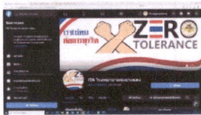
Page : ITA โรงพยาบาลทุ่งยางแดง