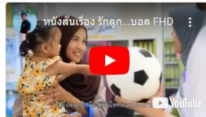
หนังสือ บันทึกสีจาง รางวัลชนะเลิศ ระดับจังหวัดปี ๒๕๖๓ และรางวัลรอง ชนะเลิศอันดับ 1 ระดับเขตบริการสุขภาพที่ 12 ภาคใต้ ปี 2560