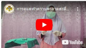
การดูแลทำความสะอาดโต๊ะอาหารแรกเกิด สื่อศึกษาสำหรับประชาชน