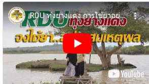
RDU หุงยางแดง มาใช้ยา อย่างสมเหตุผลกัน เถอะ สื่อศึกษาสำหรับประชาชน